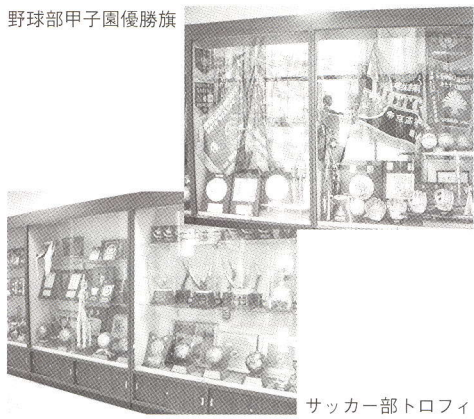
サッカー部トロフィ